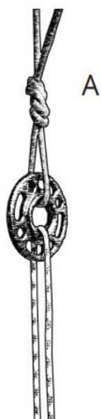
Figura 1. Móvil: Una sola cuerda que pasa a través del anclaje en una instalación de cuerda móvil.

La(s) cuerda (s) de acceso pueden entonces anclarse en tres configuraciones diferentes.