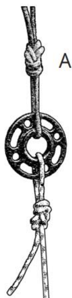
Figura 2. Estacionaria simple: Una sola cuerda anclada utilizando un nudo en ocho trazado en una instalación de cuerda estacionaria.