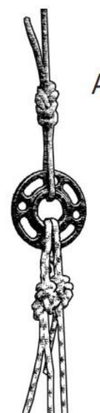
Figura 3. Doble estacionaria: Cuerdas dobles ancladas utilizando nudos en ocho trazados en una instalación de cuerda estacionaria.